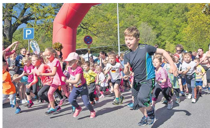
Schon die Kleinsten sind mit vollem Einsatz am Start.