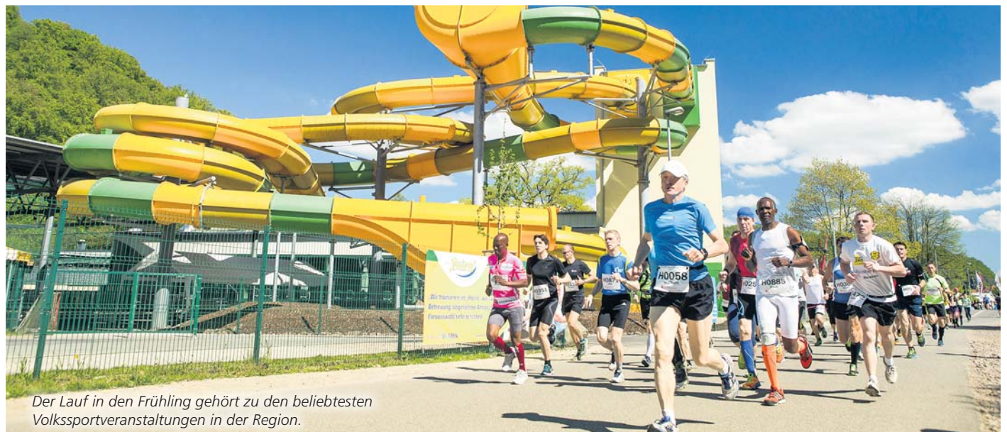
Der Lauf in den Frühling gehört zu den beliebtesten Volkssportveranstaltungen in der Region.